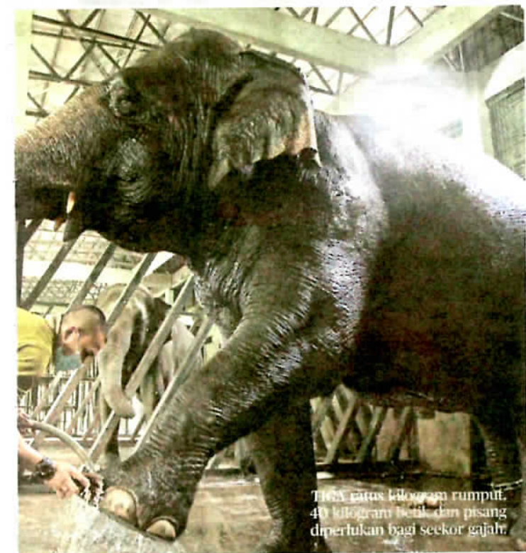
Terdapat ratusan kilogram rumput, 40 kilogram betis dan pisang diperlukan bagi seekor gajah.

mai yang paling terbaharu, kami masih tidak tahu jumlah sebenar namun agak menggalakkan terutama daripada rakyat di luar negara," katanya.