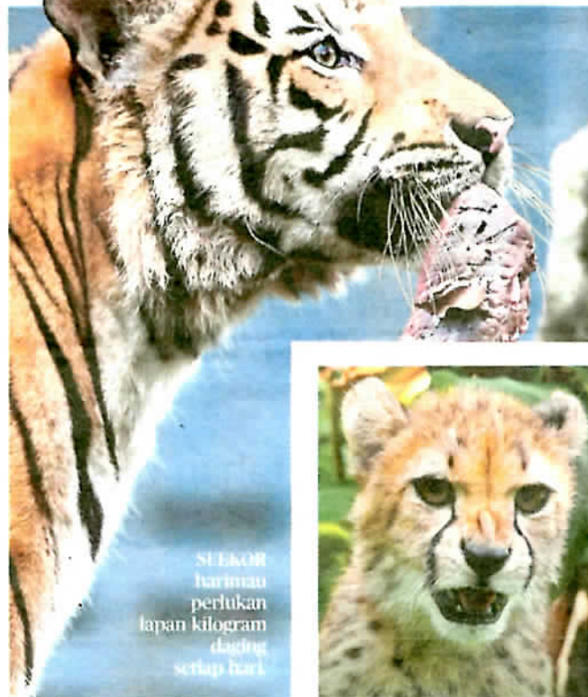
SEKOR harimau perlukan lapan kilogram daging setiap hari.

Kekurangan dana mungkin dorong penutupan Zoo Negara sebagai jalan terakhir